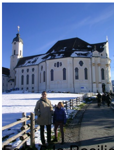
Foto 7 Basilica barocca di Wieskirche

Domenica 11 Novembre 2012 00:00 - Ultimo aggiornamento Giovedì 22 Novembre 2012 15:32