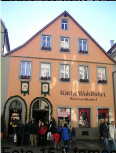
Foto 16 ingresso negozio di regali di Natale della famiglia Wohlfahrt