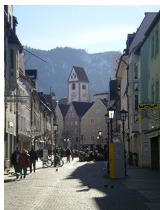
Foto 5 il centro di Fussen