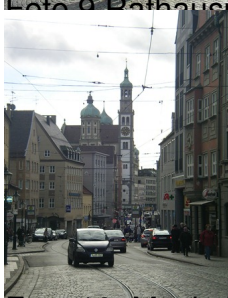
Foto 10 Maximilianstraße, la via principale di Augusta