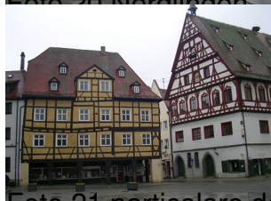
are della piazza di Nördlingen