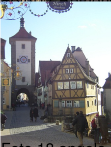
Foto 18 angolo pittoresco e romantico di Rothenburg ob der Tauber