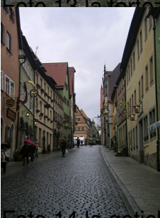
Foto 14 veduta via di Rothenburg ob der Tauber