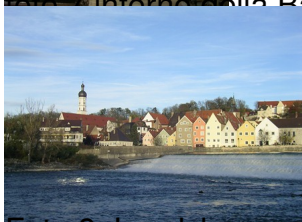
Foto 9 Landsberg am Lech