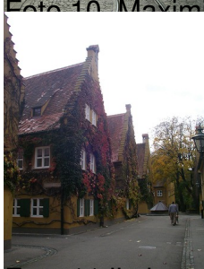
Foto 11 il pittoresco quartiere di Fuggerei ad Augusta