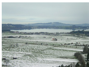
Foto 4 Nei dintorni di Fussen, il lago e pianura imbiancata