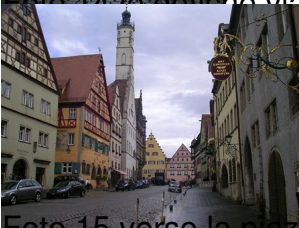
Foto 15 veduta piazza di Rothenburg ob der Tauber