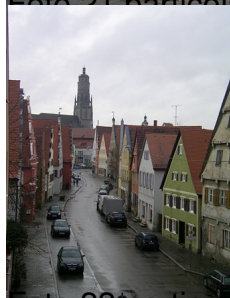
Foto 22 particolare via di Nördlingen