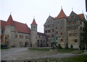
Foto 12 la fortezza di Harburg