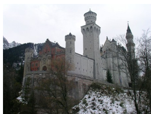
Foto 1 Castello di Neuschwanstein