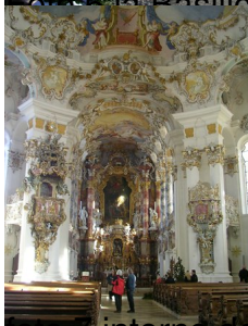
Foto 8 Interno della Basilica