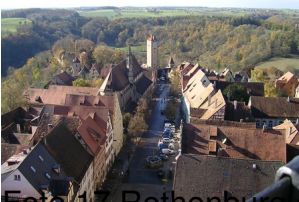
Foto 17 Rothenburg ob der Tauber vista dall'alto che si apre verso la colorita pianura bavarese